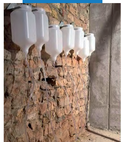
Нагнетание самотеком из емкостей