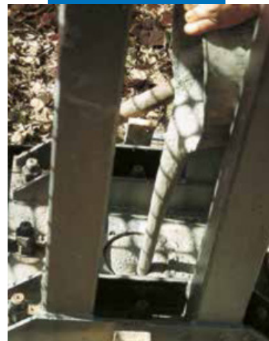
Анкерное крепление с помощью раствора Mapefill