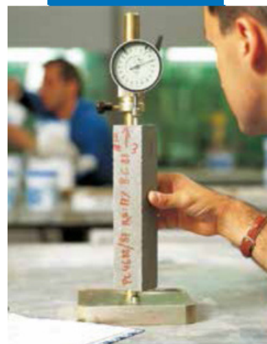
Определение расширения в стесненных условиях