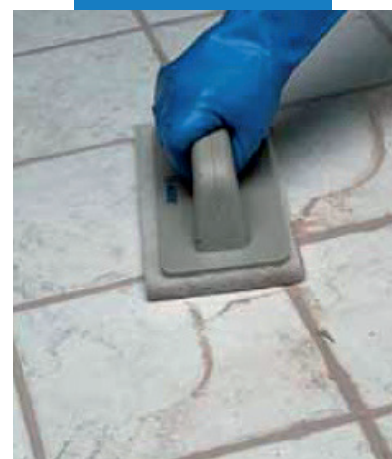
Очистка с помощью панели Scotch-Brite®