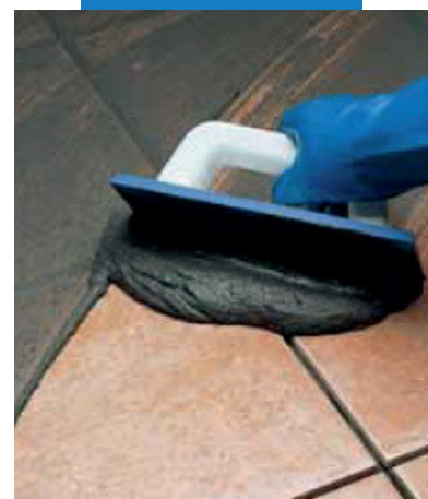
Заполнение швов в плитке на полу резиновым шпателем