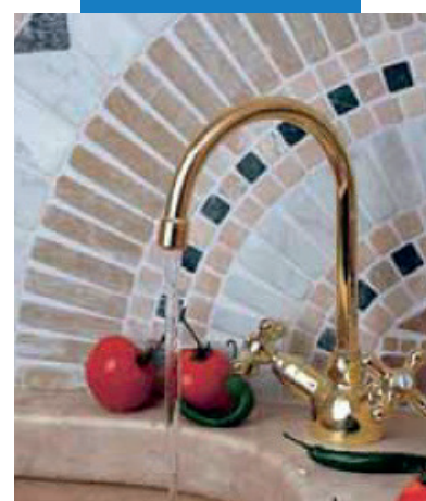
Пример заполнения швов в мозаике на кухне