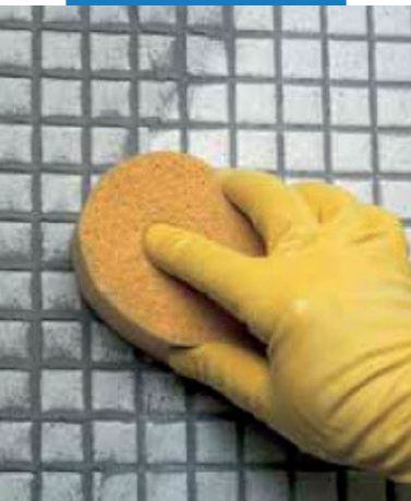
Очистка стеклянной мозаики губкой