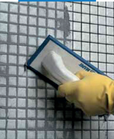
Заполнение швов в стеклянной мозаике (ванная комната) шпателем