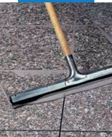
Заполнение швов в гранитных полах резиновой раклей