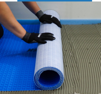
Приклеивание Mareguard 3 (Малегард 3)