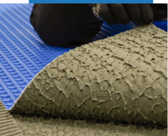
Смачивание задней поверхности