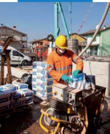
Перемешивание в смесителе Novoplan Maxi R (Новоплан Макси Р)